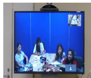
ユニセフネパール事務所