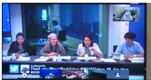
世界銀行東京事務所